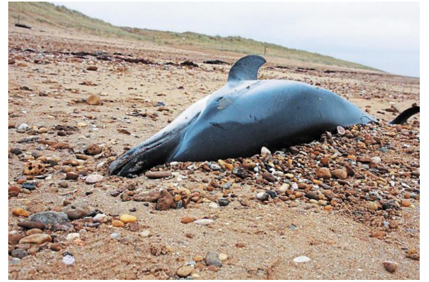
En Vendée, il n'est pas rare de voir des dauphins nager au large... Mais, parfois, leur arrive aussi de s'échouer sur nos côtes.

Mercredi, 19 dauphins se sont échoués sur l'île de Noirmoutier. Que faire si l'on tombe nez à nez avec un cétacé échoué ?